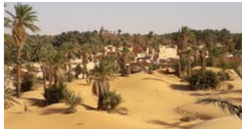
La cité de Haiha vue depuis l'erg