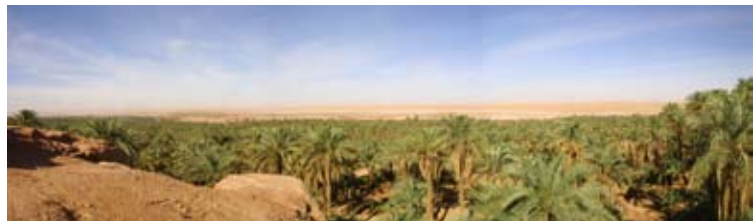
La palmeraie et l'erg vus de la terrasse du ksar Tigni