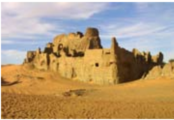
Le ksar d'Aghlad

Repas au gîte suivi d'une soirée musicale