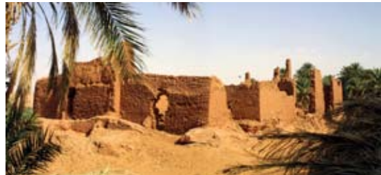
Les ruines du ksar Tigni

Coucher de soleil au gîte ou au ksar Tigni en fonction heure arrivée Repas au gîte