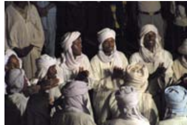
Scène de Ahellil