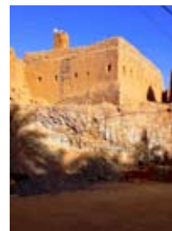
L'ancienne mosquée du ksar zouia de Guentour