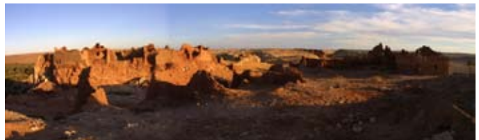
Une partie du panoram vue de l'agham Amokrane