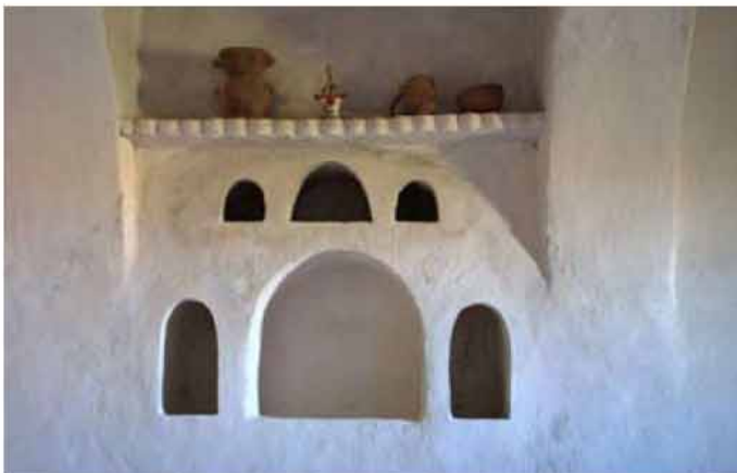
Détail de niches murales

Un vaste jardin planté de palmiers abritant des cultures vivrières et irrigué d'un joli petit bassin procure au visiteur la fraîcheur d'une ombre bienfaitrice autour d'un espace de détente avec vue sur l'erg.