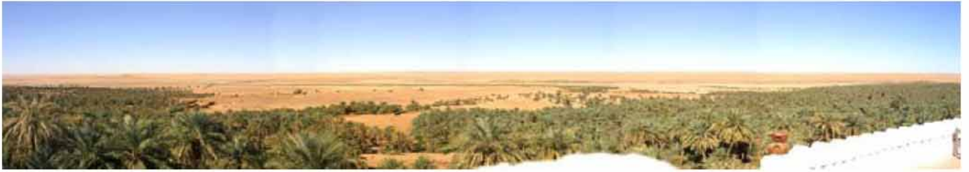
Vue depuis la terrasse du second étage