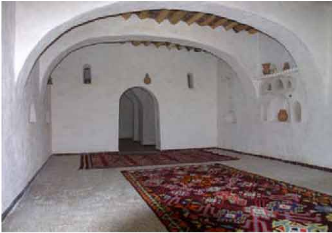
Le salon au rez de chaussée

La partie rénovée dans le respect de l'architecture traditionnelle comporte un salon , 4 chambres et une pièce destinée aux guides et chauffeurs, 5 sanitaires modernes et 2 douches en rez de chaussée , ainsi que 6 chambres dotées de salles de bains individuelles ouvrant sur les 2 niveaux de terrasse supérieurs.