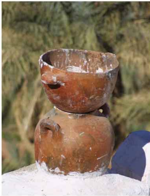
Ecarter le mauvais sort....

La partie rénovée dans le respect de l'architecture traditionnelle comporte un salon , 4 chambres et une pièce destinée aux guides et chauffeurs, 5 sanitaires modernes et 2 douches en rez de chaussée , ainsi que 6 chambres dotées de salles de bains individuelles ouvrant sur les 2 niveaux de terrasse supérieurs.